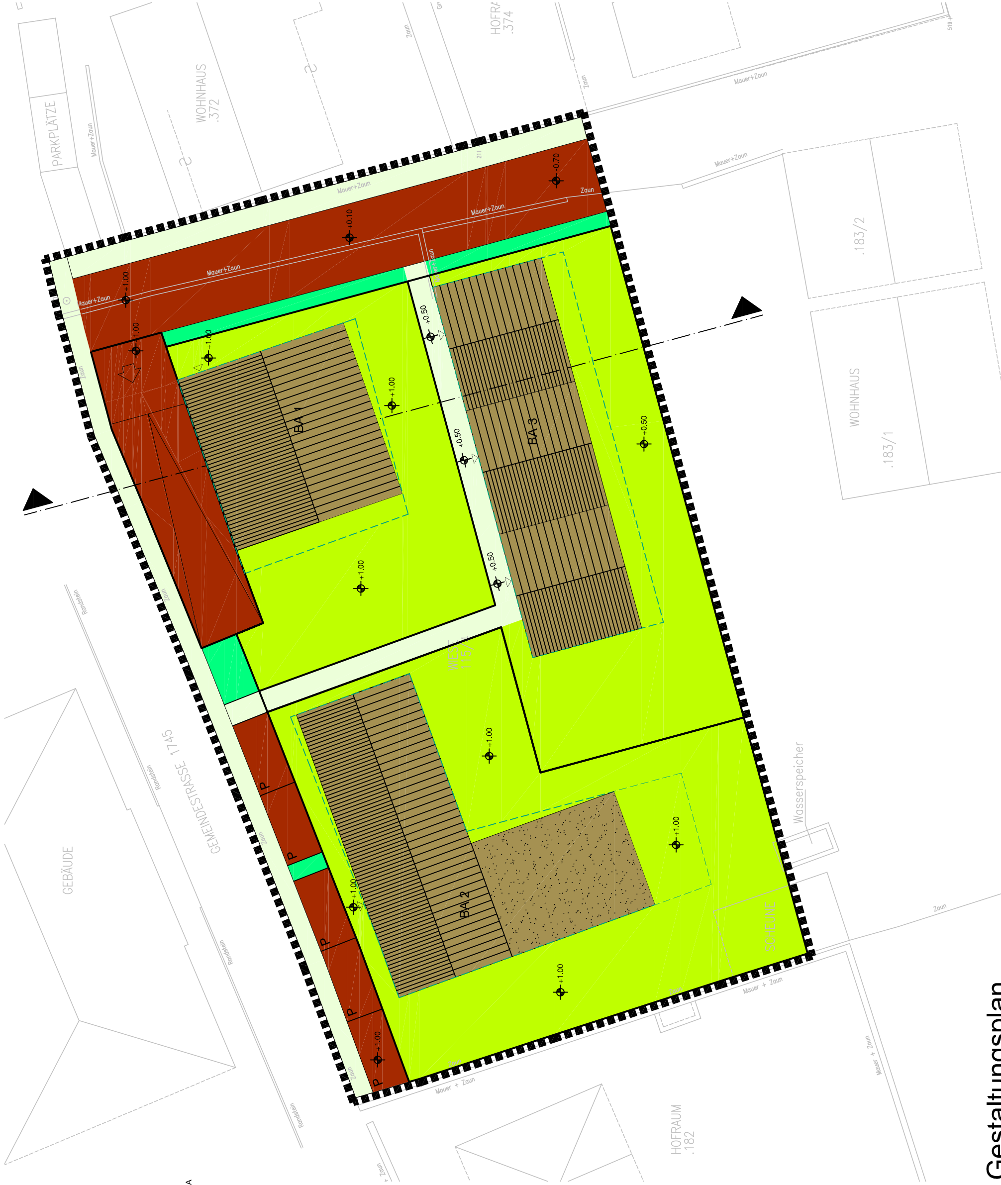
Gestaltungsplan Piano Figurativo M 1:250